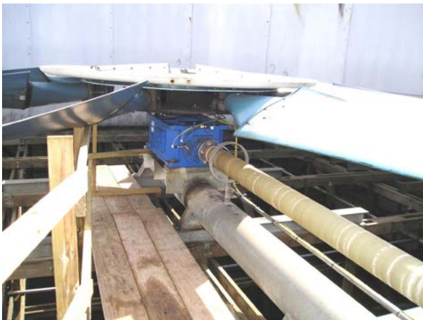
冷却塔转轴驱动型齿轮箱

冷却塔的振动传感器给振动分析师们带来了许多难点，特别是振动传感器的选择，安装和周围环境状况等等。电机一般都处于开放，便于接近的地方，但是几乎所有的故障都发生在齿轮箱。对振动分析师来说，不幸的是齿轮箱通常安装在危险的冷却塔碗下，也就刚好在旋转叶轮下面。有没有让电机很少出问题的奇迹出现呢？答案是安装永久型振动传感器可以保证其技术性和安全性。它也提高了冷却塔，包括振动分析师们的寿命和可靠性！