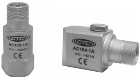
AC102-1A 和 AC104-1A 振动传感器

通用型振动传感器 AC102(正面接口)或 AC104(侧面接口)适用于测量振动值大于 30CPM(0.5 赫兹)。特殊用途的低频传感器 AC135(上出口) AC136(边出口)则适用于测量振动值大于 12CPM(0.2 赫兹)。