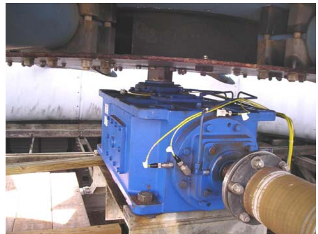
齿轮箱输入轴承机架上的 径向和轴向传感器

加速度振动传感器通常安装在电机和齿轮箱的重要位置上。由于齿轮箱是机械驱动链的负载轴承部分，加速度振动传感器应安装在输入和输出轴承机架上，以便测量其振动状态。