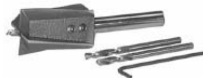
孔口平面, 钻孔后攻螺纹以便螺钉安装