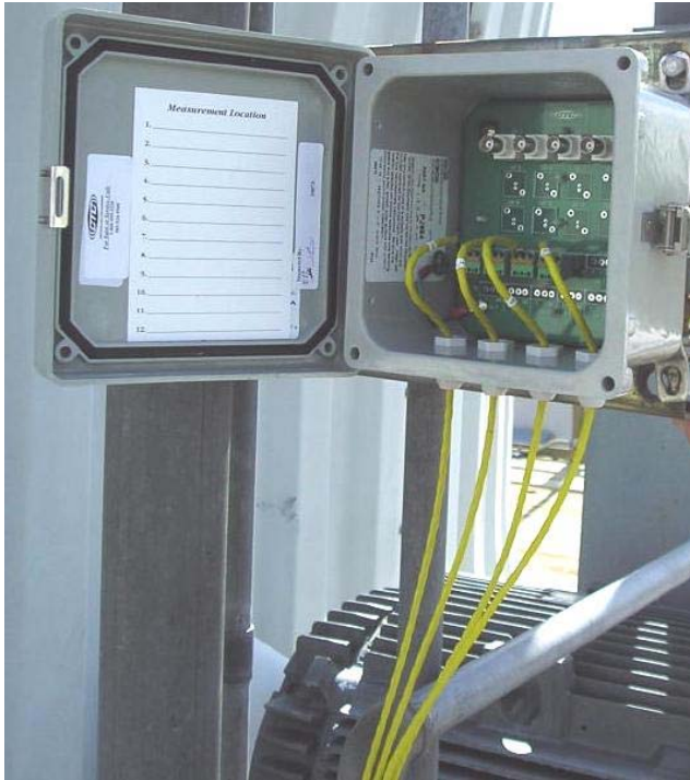
MX102-4C MAXX 接线箱带有 4 个频道 安装在冷却塔外面

对振动传感器来说安全可靠的连接是十分关键的.这也同样适用于数据采集器的电缆连接.有几种方式可以保证传感器电缆和数据采集器之间的连接干燥,干净,有序.便携式数据采集器的连接可以采用 MAXX 接线箱或者开关箱.这两种方式都可以为数据采集器提供方便的连接.永久安装型监视器的连接可以使用开关箱或信号管理箱,这两种方式都可以避免电缆交杂,更好的管理你的数据采集端口.